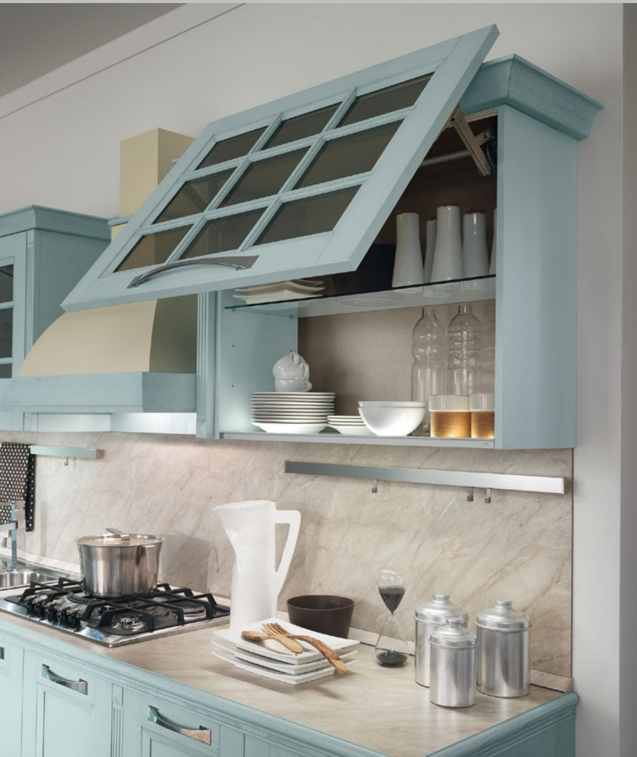
Particolare di vetri stop sol, rinnovato connubio tra tradizione e innovazione.