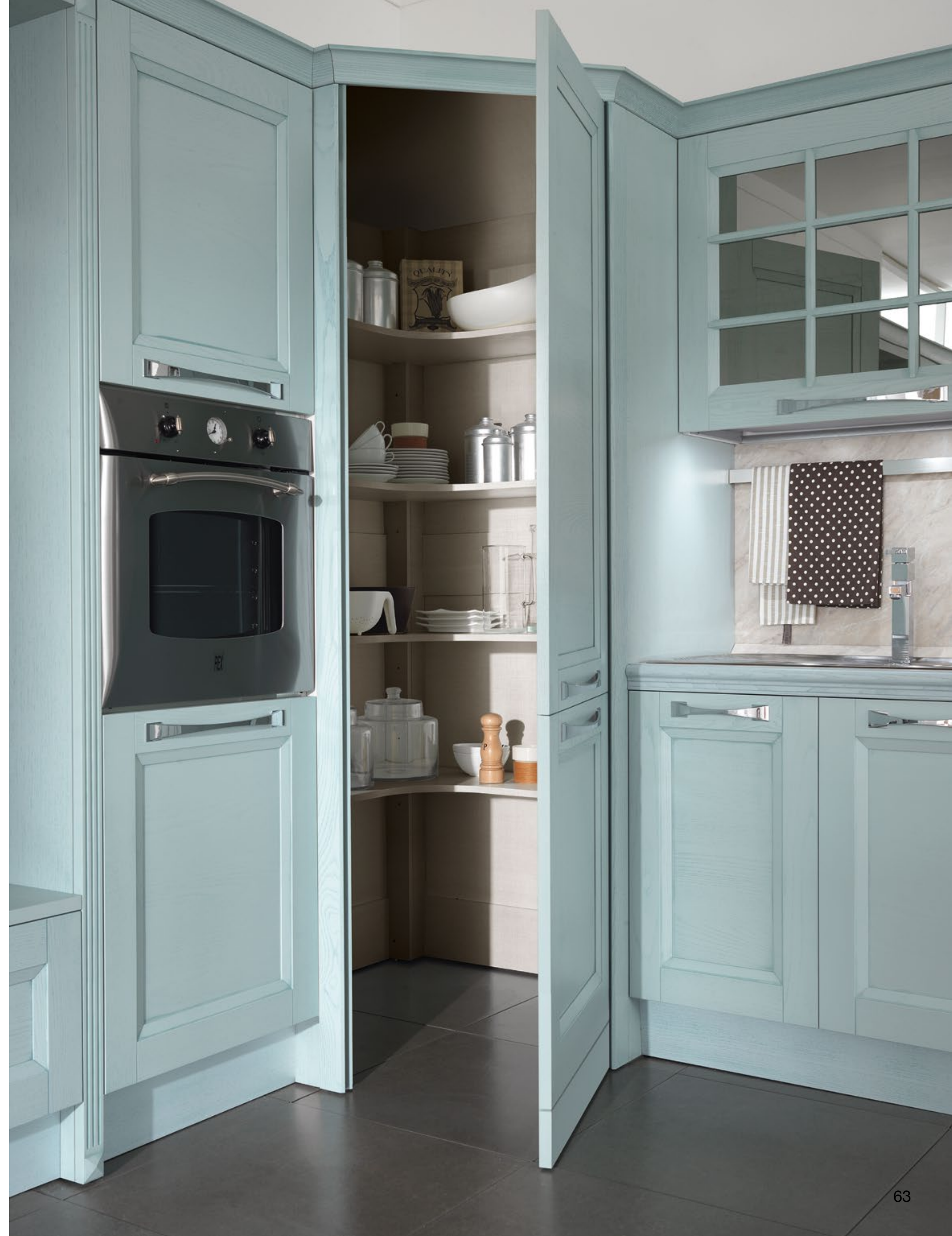
Особенность стекла stop sol - это обновлённое переплетение традиций и инноваций.