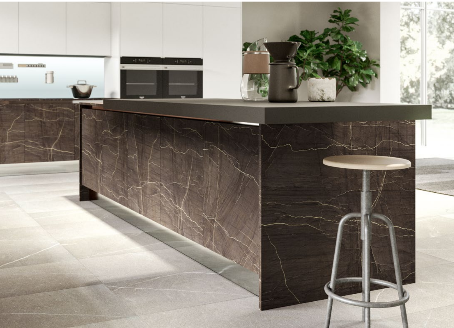
PIANO SNACK AGGETTANTE IN FENIX NTM GRIGIO BROMO.

PROTRUDING SNACK TOP IN FENIX NTM GRIGIO BROMO.