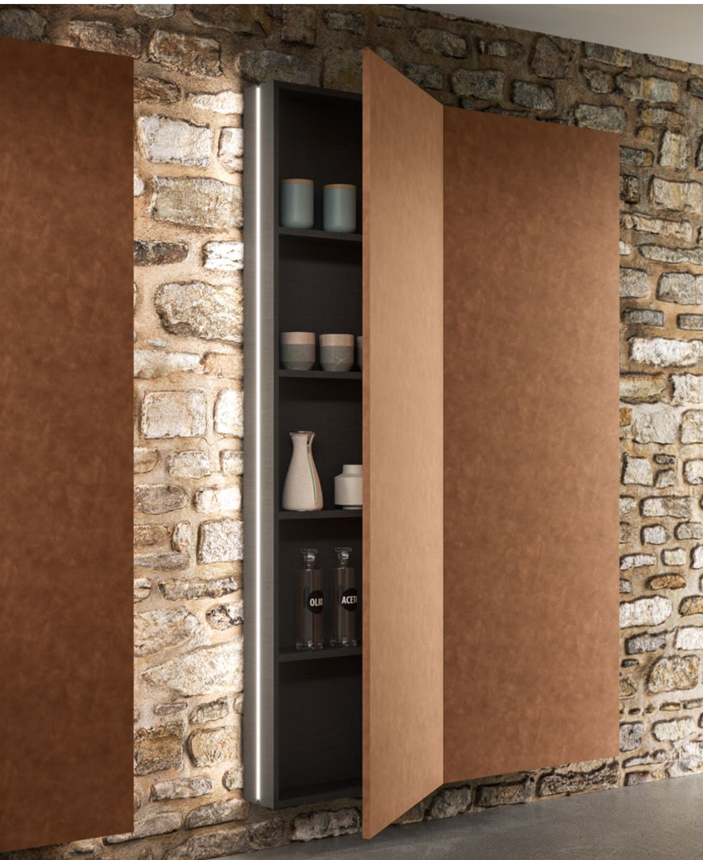
COLONNE E SCHIENALI BROWN LARCH.