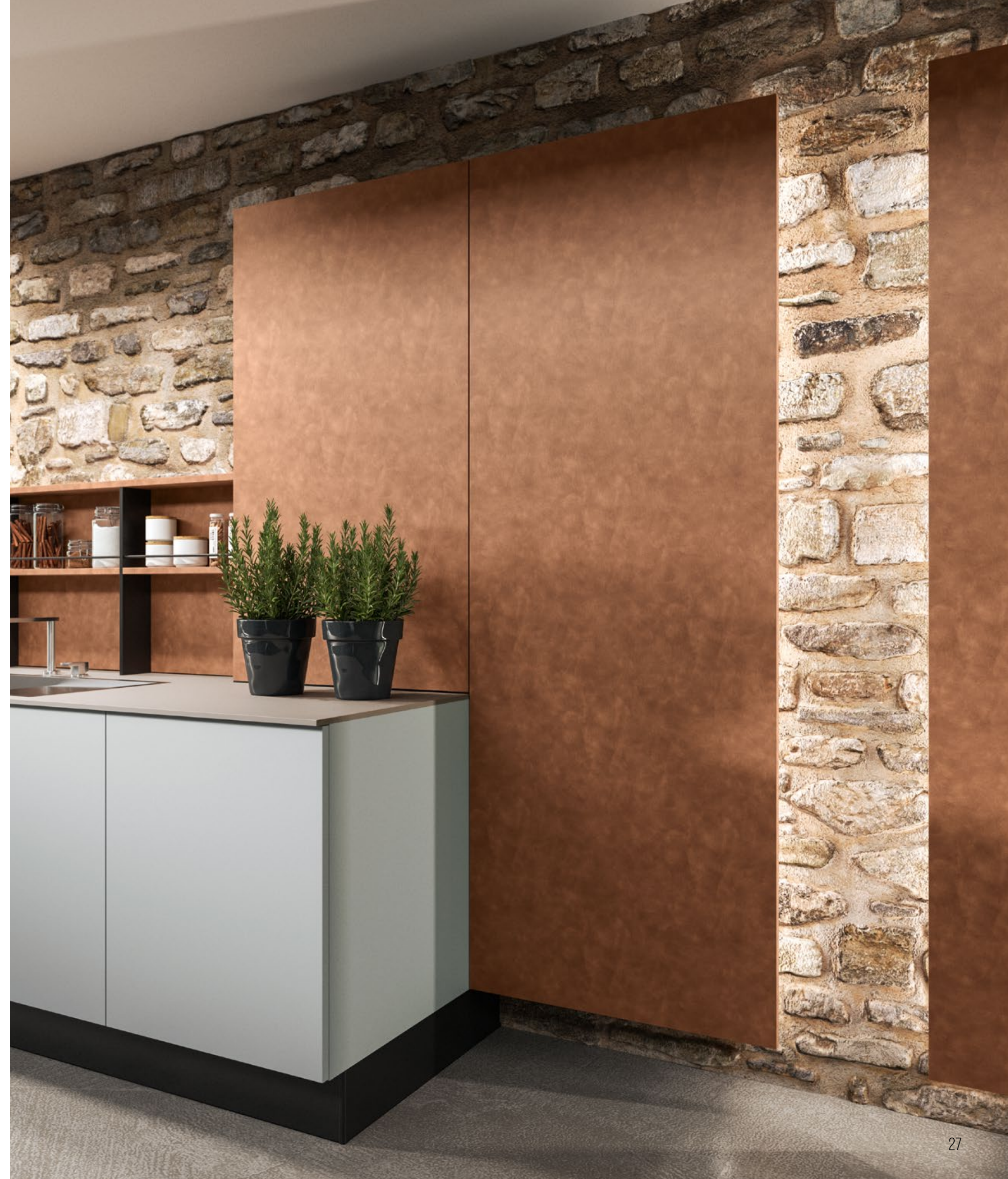
ШКАФЫ И СТЕНОВЫЕ ПАНЕЛИ BROWN LARCH.