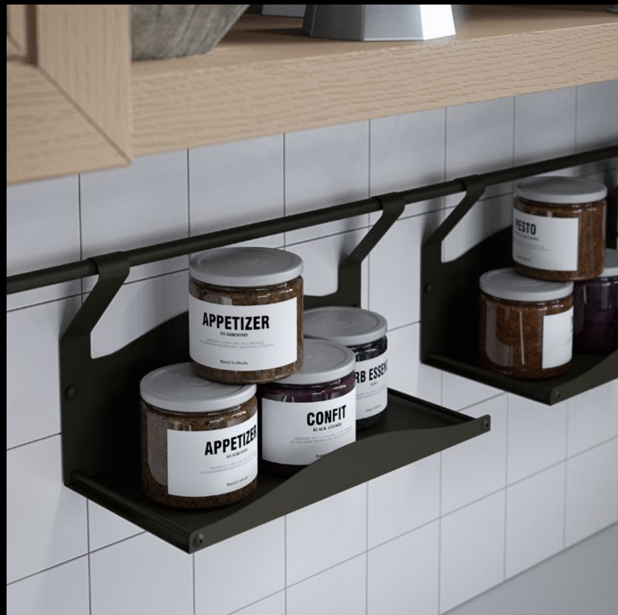
Lacquered white ash. Fresno lacado blanco. Frêne blanc laqué. Esche Weiss lackiert. Ясень лакированный белый.