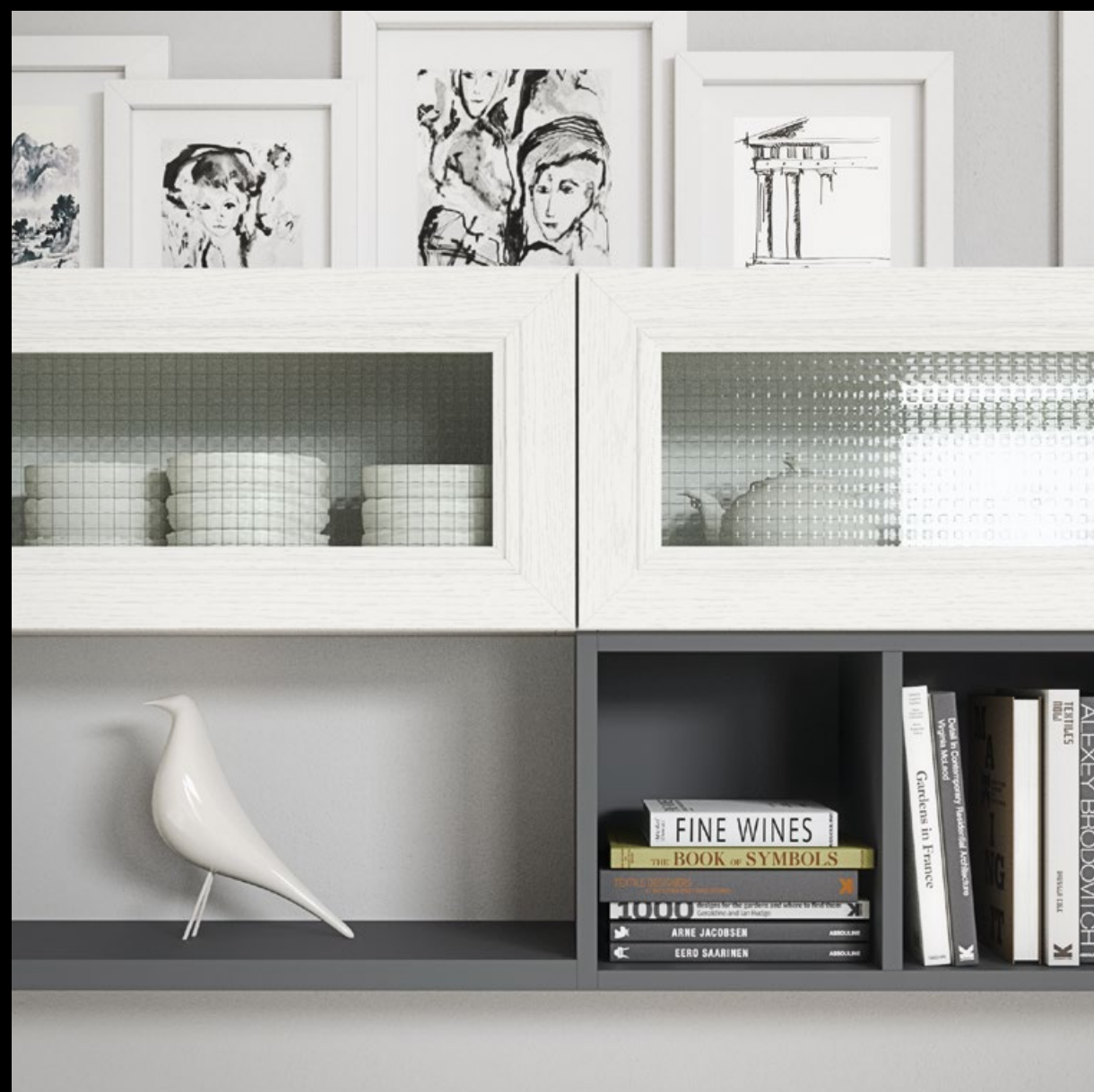
Lacquered white ash. Fresno lacado blanco. Frêne blanc laqué. Esche Weiss lackiert. Ясень лакированный белый.