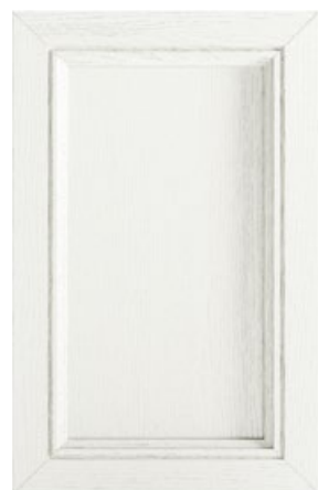
LACCATO BIANCO White Lacquered Lacado blanco Laqué blanc Lackiert Weiss Белый лакированный

WOOD DOORS - PUERTAS MADERA - PORTES BOIS - FRONTEN HOLZ - ДВЕРКИ В ОТДЕЛКЕ ДЕРЕВО