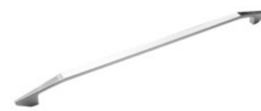
STELO Cromo - Chrome - Cromo Chrome - Chrom - Хром

STANDARD - DE SERIE - STANDARD - STANDARD - СЕРИЙНЫЕ