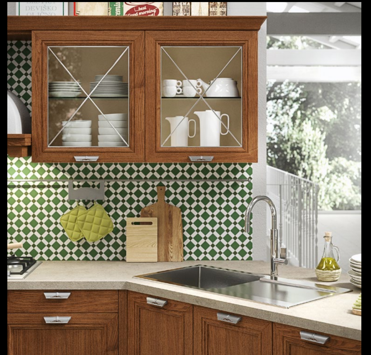
Antique oak stained ash with nickel plated brass bound glass. Fresno tinto roble antiguo con cristal engarzado en latón niquelado. Frêne teinté chêne antique avec verre lié au laiton nickelé. Esche gebeizt in Antik-Eiche und gebundenes Glas mit vernickeltem Messing. Ясень с о отделкой под состаренный дуб со стеклом в рамке из никелированной латуни.