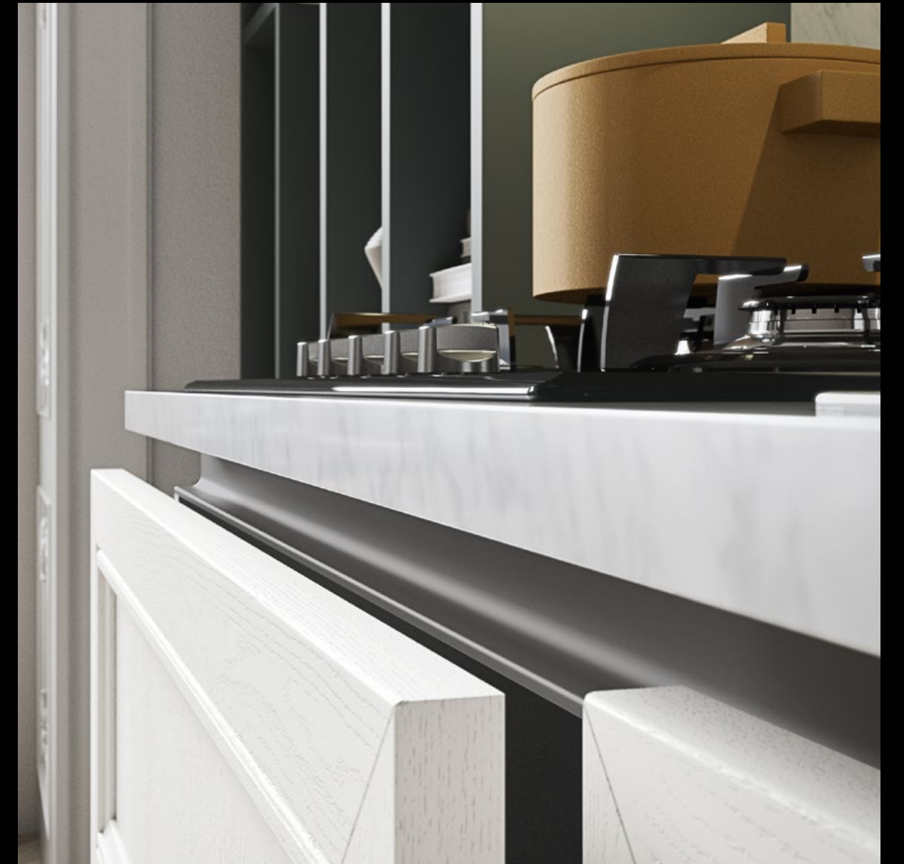
Frassino laccato bianco.