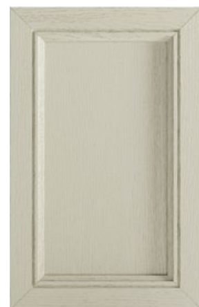
LACCATO VERDE Green Lacquered Lacado verde Laqué vert Lackiert Grün Зелёный лакированный