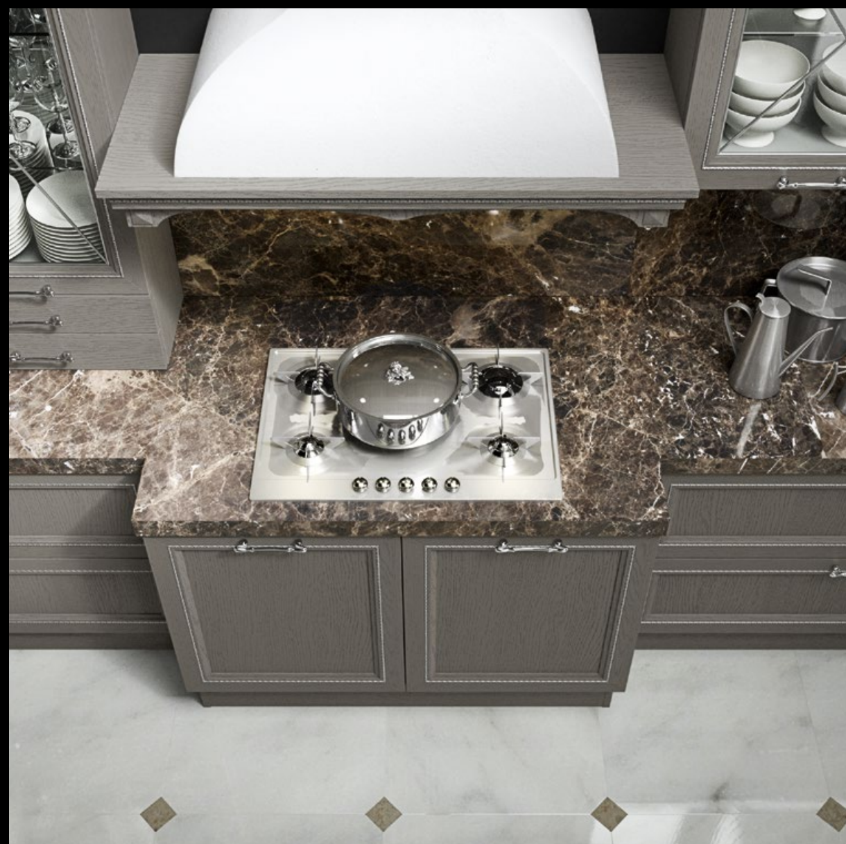
Pickled titanium lacquered ash with silver insert. Fresno lacado titanio decapé con aplicación plata. Frêne laqué titan cendres décapé avec insert en argent. Esche Decapé Titanfarbe lackiert mit Silbereinsatz. Ясень лакированный декапированный в отделке титан с серебряными вставками.