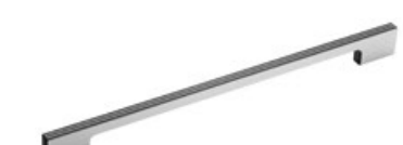
STRATY Alluminio - Aluminium - Aluminio Aluminium - Aluminium - Алюминий

Interasse - Handle Center pull - Paso Entraxe - Achsabstand - Межосеовое расстояние 64-160-320 mm