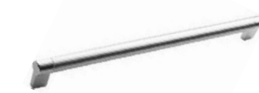
TECA Nichel - Nickel - Níquel Nickel - Nickel - Никель

Interasse - Handle Center pull - Paso Entraxe - Achsabstand - Межосеовое расстояние 64-160-320 mm