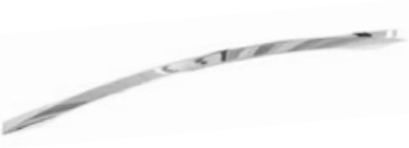
LIRA Cromo - Chrome - Cromo Chrome - Chrom - Хром

Interasse - Handle Center pull - Paso Entraxe - Achsabstand - Межосеовое расстояние 64-160-320 mm