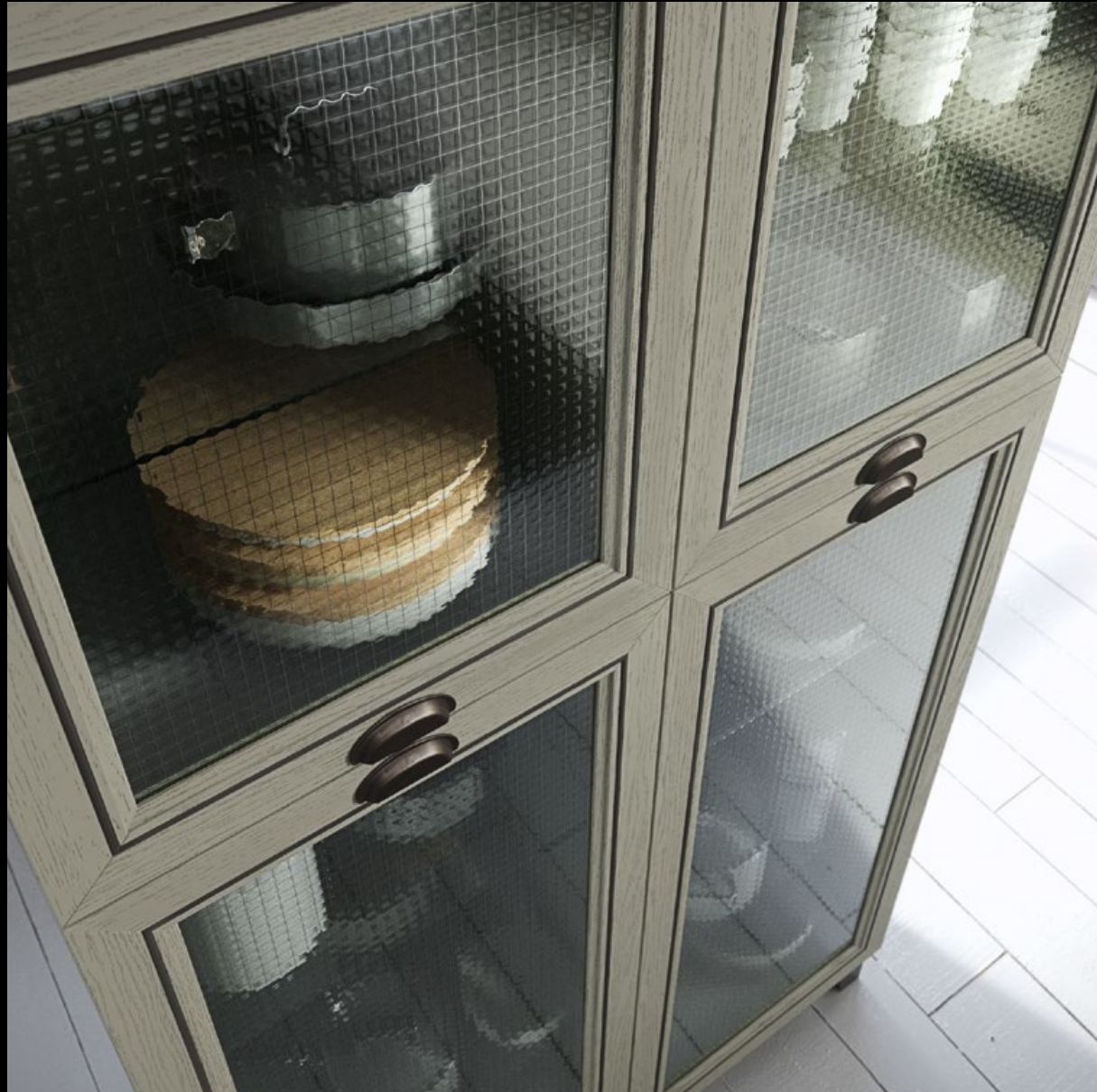
Frassino laccato verde con inserto dal colore metallo invecchiato.