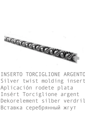
INSERTO TORTIGLIONE ARGENTO Silver twist molding insert Aplicación rodete plata Insért Torciglione argent Dekorelement silber verdrillt Вставка серебряный жгут