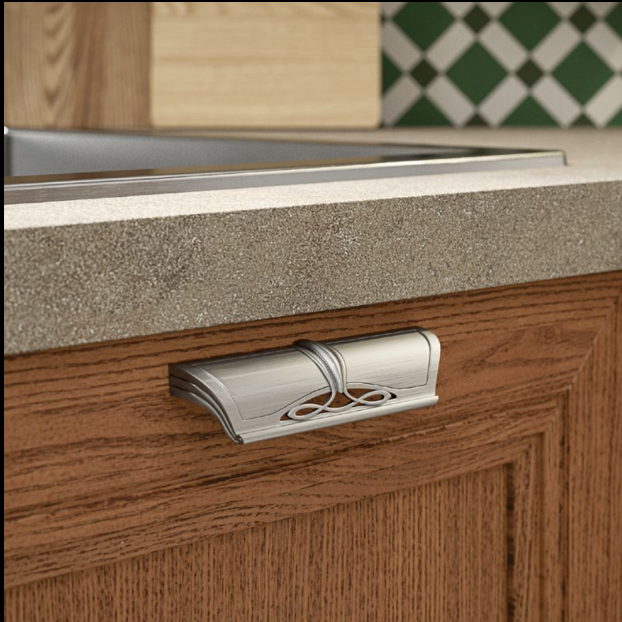
Frassino tinto rovere anticato con vetro rilegato in ottone nichelato.