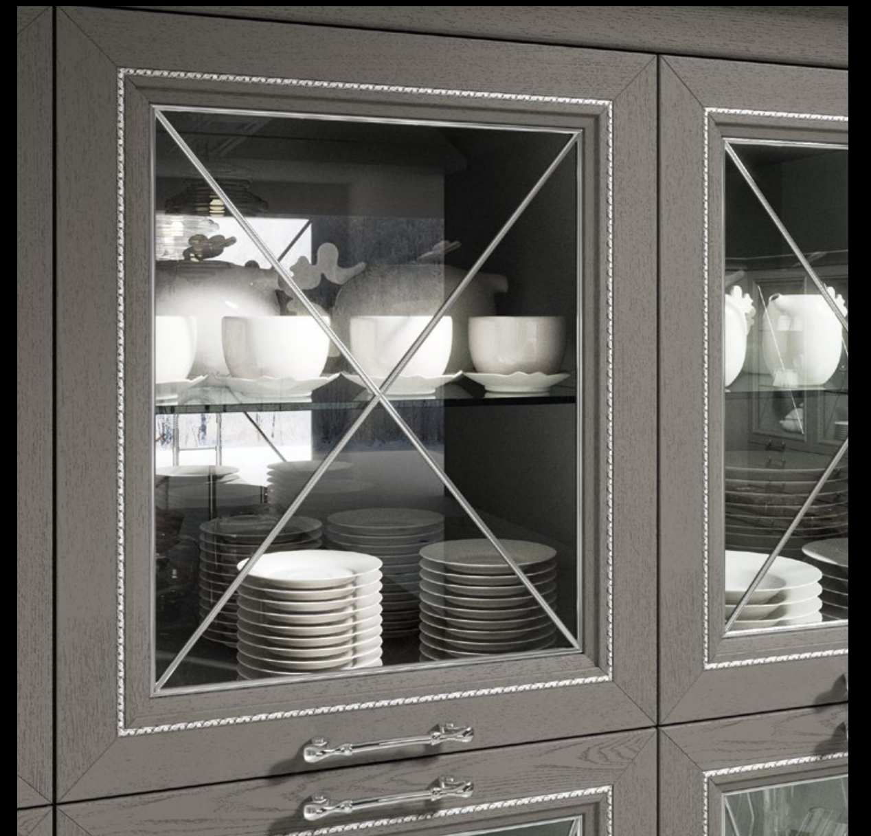
Frassino laccato titanio decapè con inserto argento.