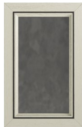
ANTA CON INSERTO E PANNELLO OFICINA Door with oficina middle panel and insert Puerta con aplicación y panel Oficina Porte avec insért et panneau Oficina Front mit Dekorelement und Paneel Oficina Дверка с вставкой и панелью Oficina