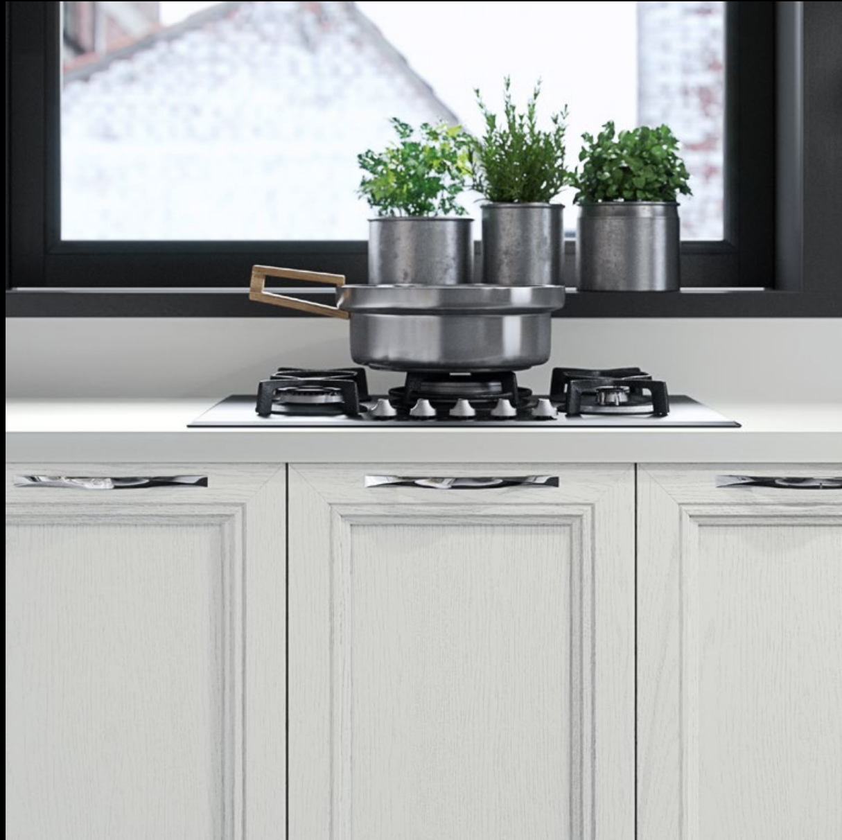
Frassino laccato bianco.