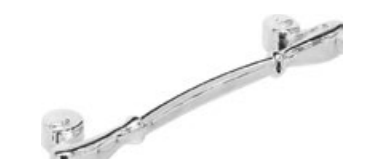
LE TUILERIE Cromo - Chrome - Cromo Chrome - Chrom - Хром

Interasse - Handle Center pull - Paso Entraxe - Achsabstand - Межосеовое расстояние 128 mm