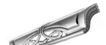
ARABESQUE Acciaio - Stainless Steel - Acero Acier - Edelmetall - Нержавеющая Сталь

Interasse - Handle Center pull - Paso Entraxe - Achsabstand - Межосеовое расстояние 96 mm