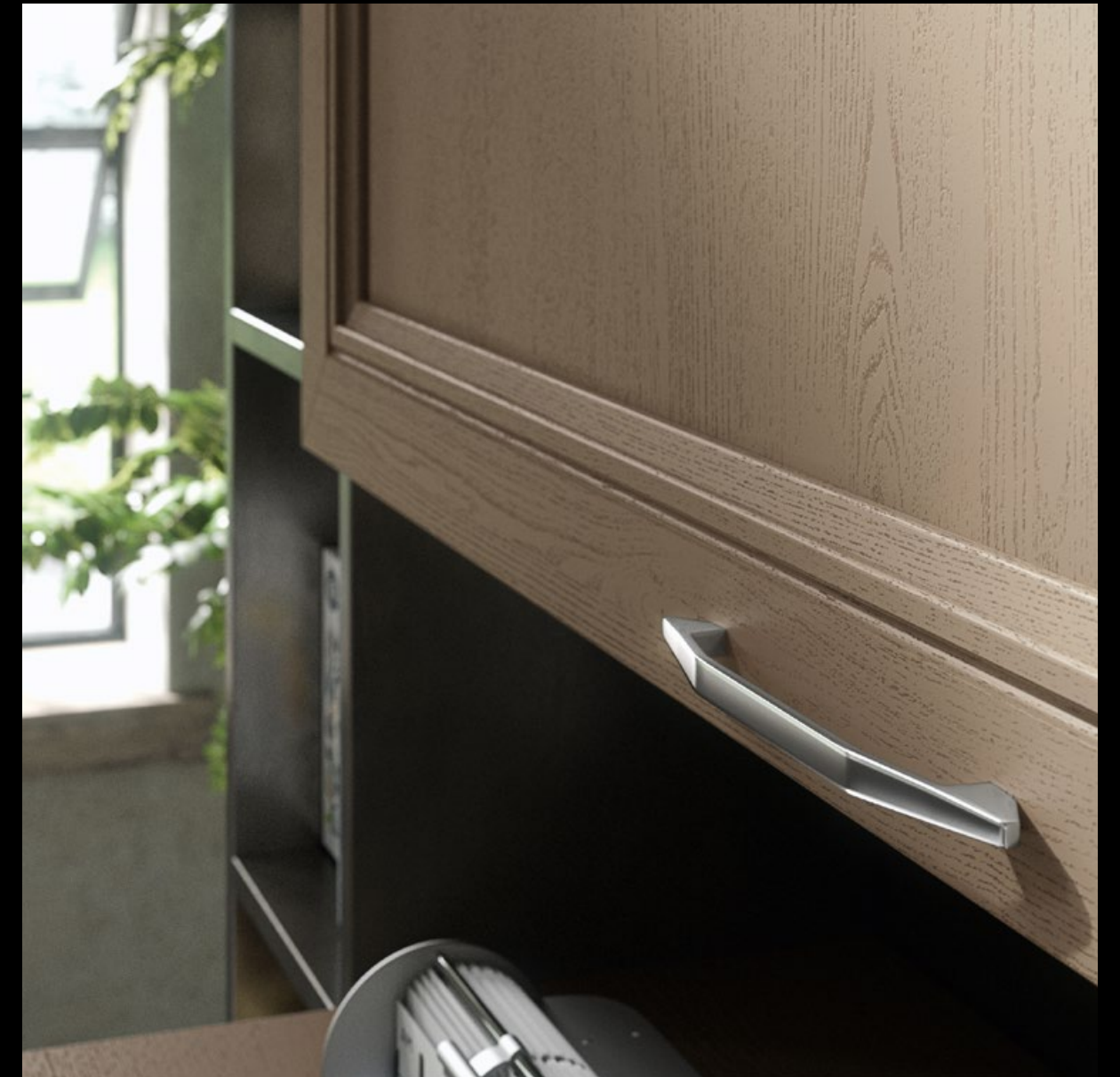
Frassino laccato argilla decapè, vetro retinato.