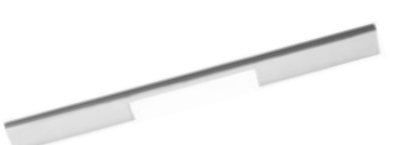
MINI Acciaio Inox - Stainless Steel - Acero Acier - Edelmetall - Нержавеющая Сталь

Interasse - Handle Center pull - Paso Entraxe - Achsabstand - Межосеовое расстояние 64-160-320 mm