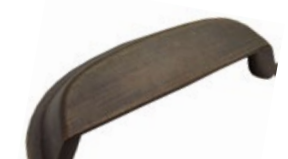
HISTORIA Ottone - Brass - Latón Laiton - Messing - Латунь

Interasse - Handle Center pull - Paso Entraxe - Achsabstand - Межосеовое расстояние 64-160-320 mm