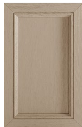
LACCATO ARGILLA DECAPÉ Pickled lacquered clay Lacado arcilla decapé Laqué argile décapé Lackiert Lehm Decapé Глиняный декапированный лакированный