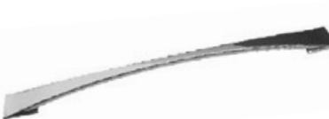
FORMA Cromo - Chrome - Cromo Chrome - Chrom - Хром

AVAILABLE HANDLES - OPCIONES TIRADORES - OPTION POIGNEE - GRIFFOPTIONEN - ОПЦИОННО РУЧКИ