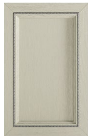
ANTA CON INSERTO TORTIGLIONE ARGENTO Door with silver twist molding insert Puerta con aplicación rodete plata Porte avec insért Torciglione argent Front mit Dekorelement silber verdrillt Дверка с вставкой серебряный жгут