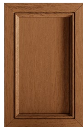
TINTO ROVERE ANTICATO Stained antique oak Tinto roble antiguo Tinté chêne antique Ausführung Alteiche gebeizt Отделка под состаренный дуб