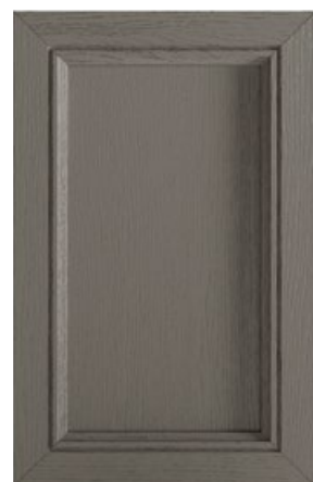
LACCATO TITANIO DECAPÉ Pickled lacquered titanium Lacado titanio decapé Laqué Titanium décapé Lackiert Titanfarbe Decapé Титановый декапированный лакированный