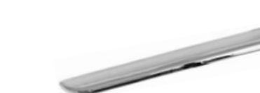
VEGA Cromo - Chrome - Cromo Chrome - Chrom - Хром

Interasse - Handle Center pull - Paso Entraxe - Achsabstand - Межосеовое расстояние 64-160-320 mm