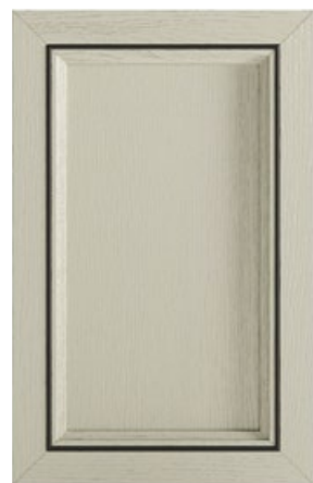
ANTA CON INSERTO OFICINA Door with oficina insert Puerta con aplicación Oficina Porte avec insért Oficina Front mit Dekorelement Oficina Дверка с вставкой Oficina