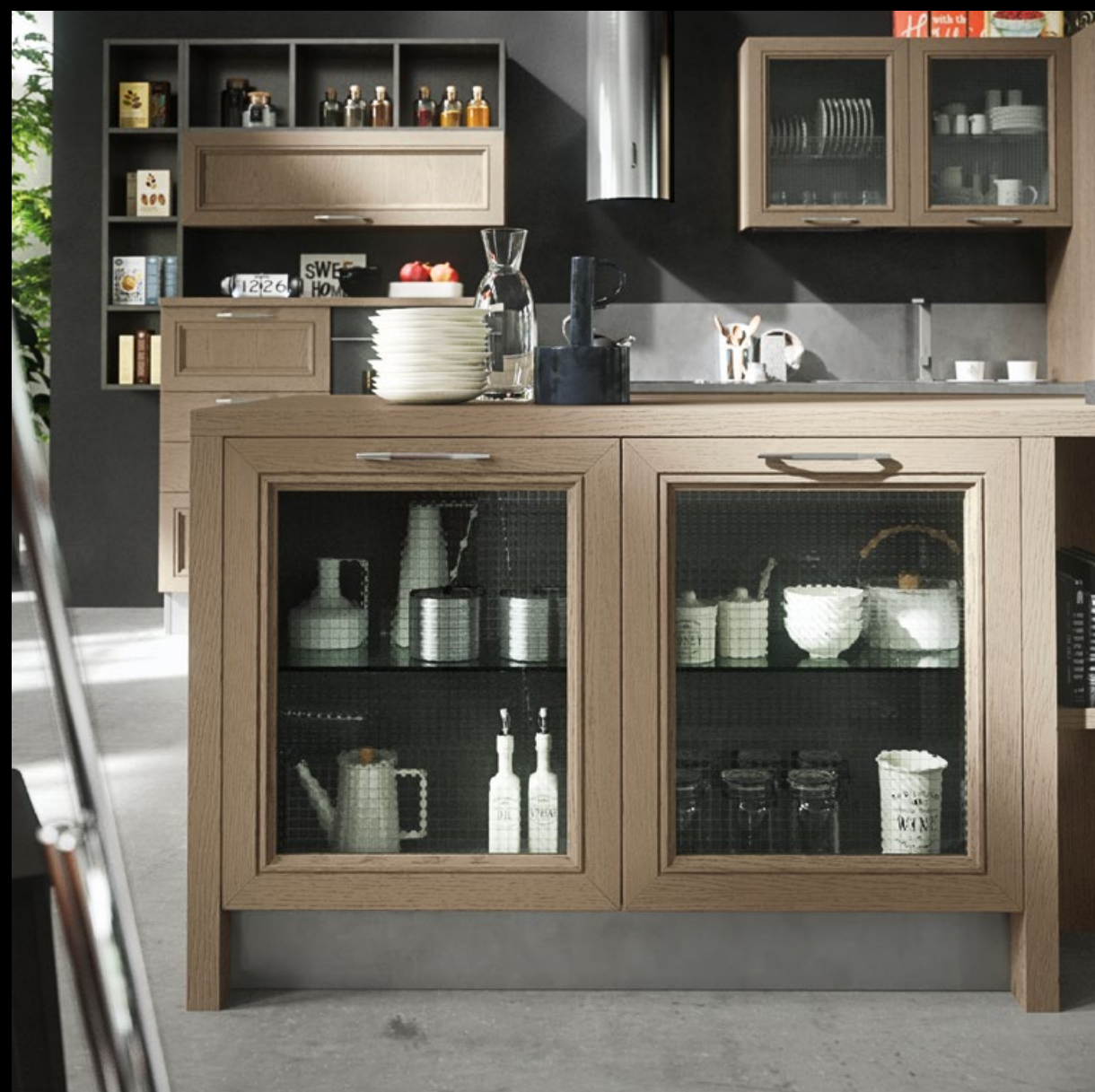
Pickled clay lacquered ash, wired glass. Fresno lacado arcilla decapé, cristal armado. Frêne laqué argille décapé, verre armé. Esche Decapé Lehm lackiert, Drahtglas. Ясень лакированный глина декапированный, стекло армированное.