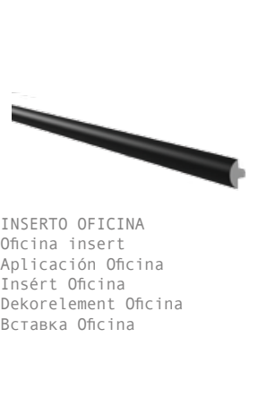
INSERTO OFICINA Oficina insert Aplicación Oficina Insért Oficina Dekorelement Oficina Вставка Oficina